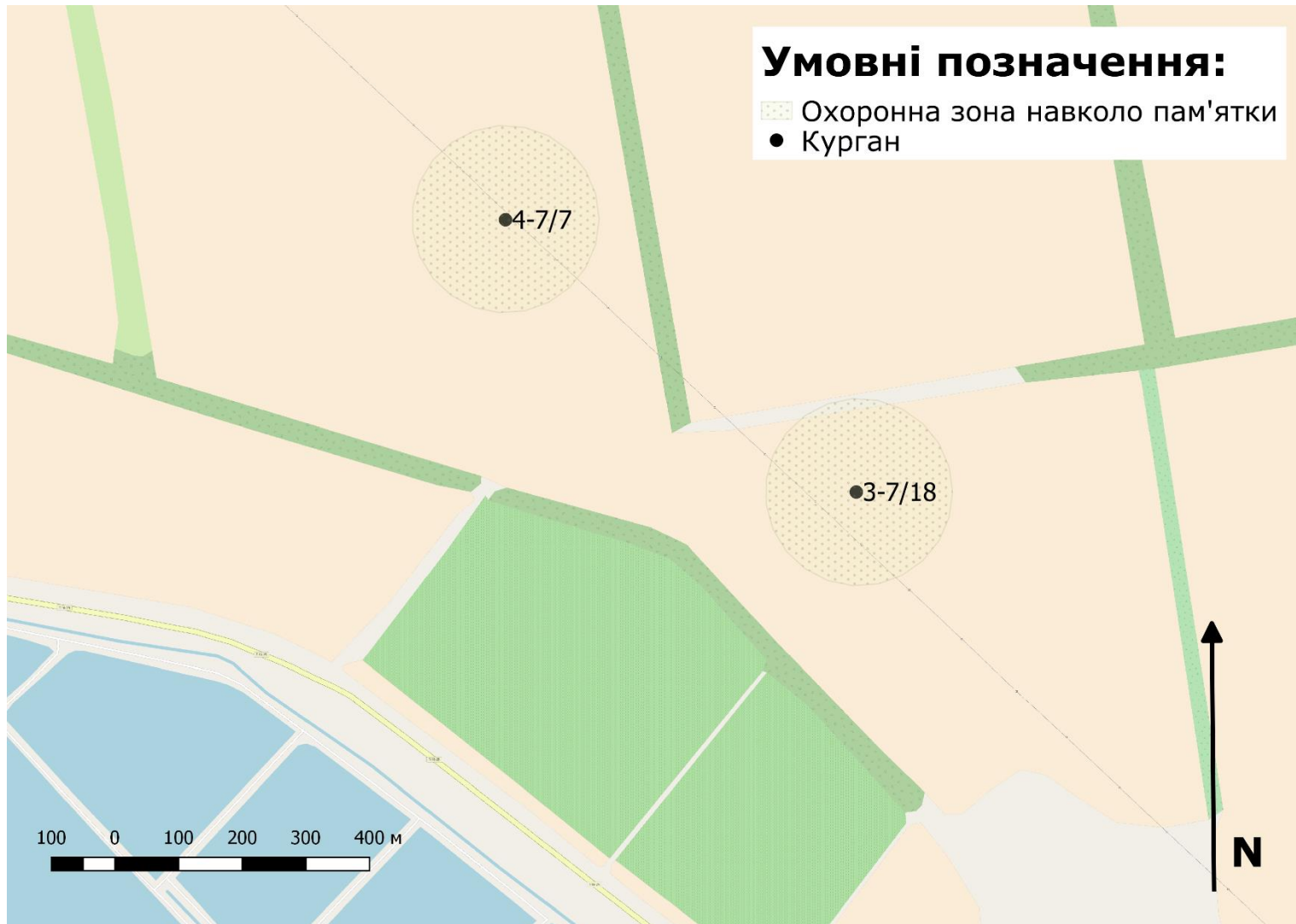
Карта 2. Генеральний план території. Викопіювання з OpenStreetMap М 1:10 000