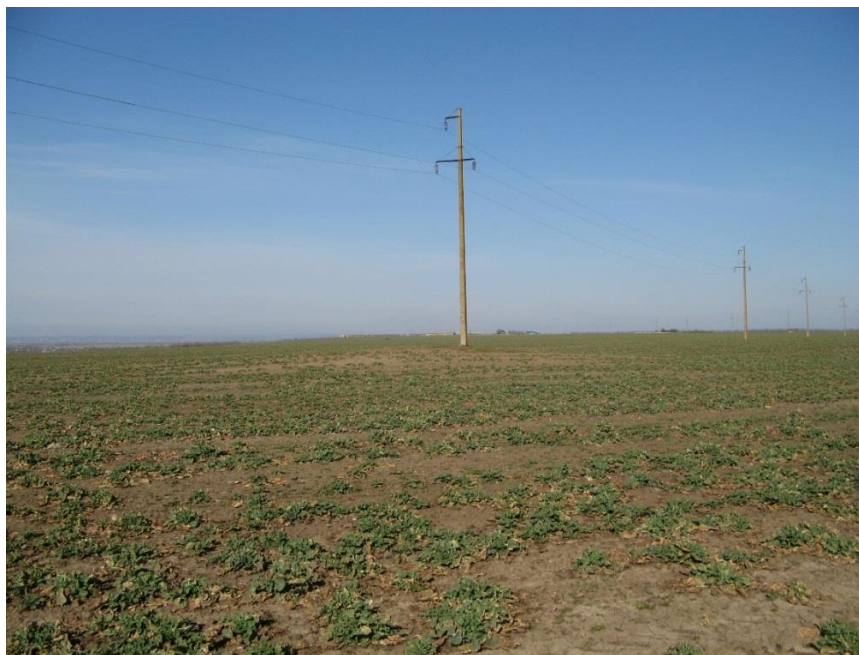
ВИД НА КУРГАН №4 З ПІВДЕННОГО СХОДУ