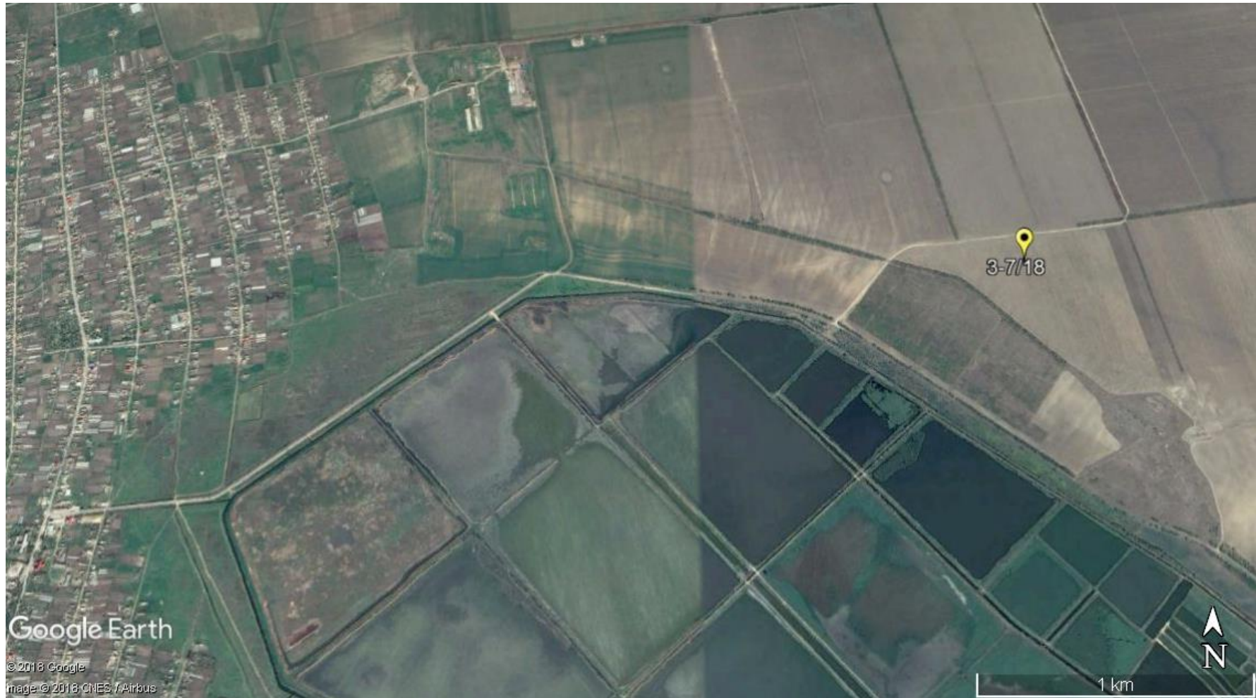
Карта 1. Виколювання з Google Earth Pro М 1:15 000