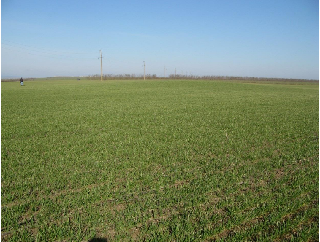
ВИД НА КУРГАН №3 З ПІВДЕННОГО СХОДУ

Додаток Курган № 3 Одеська обл., Біляївський р-н, с. Яськи ФОТОФІКСАЦІЯ