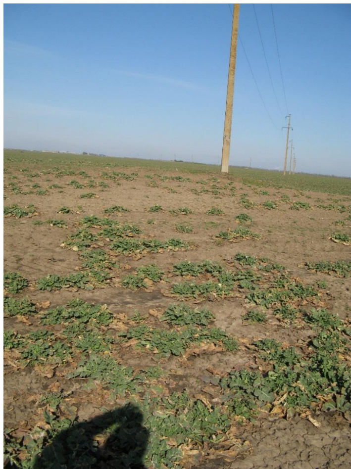
ВИД НА КУРГАН №4 З ПІВДНЯ