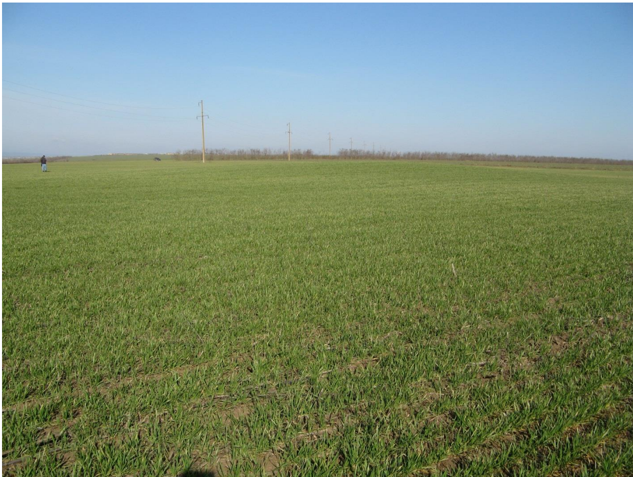
ВИД НА КУРГАН №3 З ПІВДЕННОГО СХОДУ