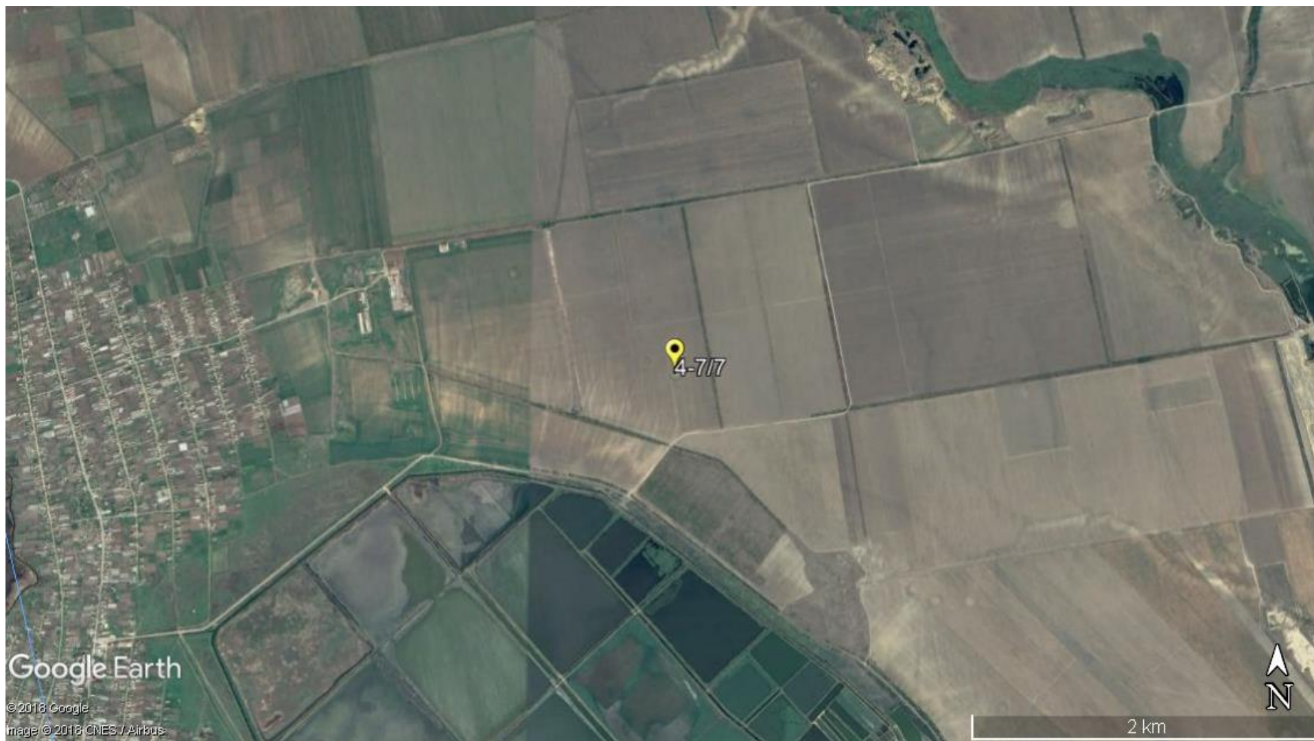
Карта 1. Випіювання з Google Earth Pro М 1:15 000