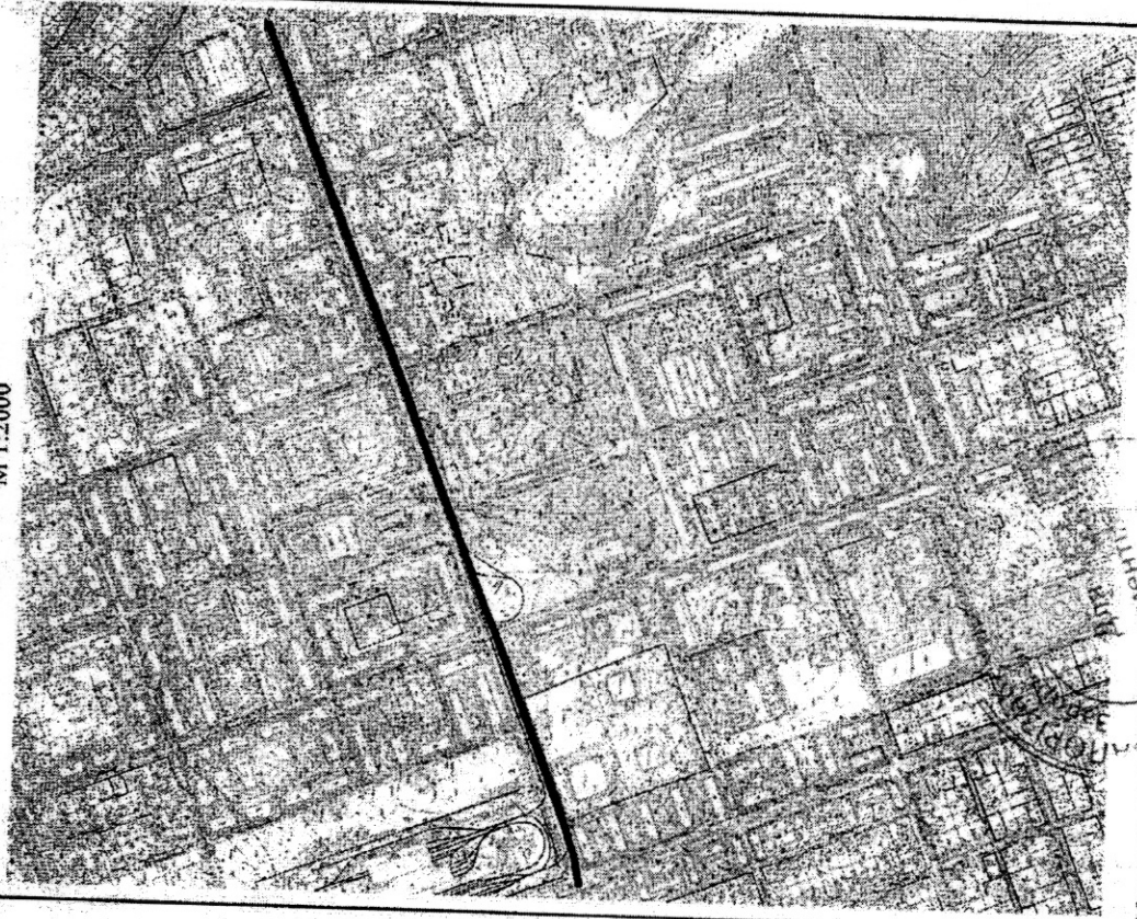
СХЕМА розташування вулиці Мирослава СИМЧИЧА М 1:2000

Додаток до рішення міської ради 29.11.2023 № 81