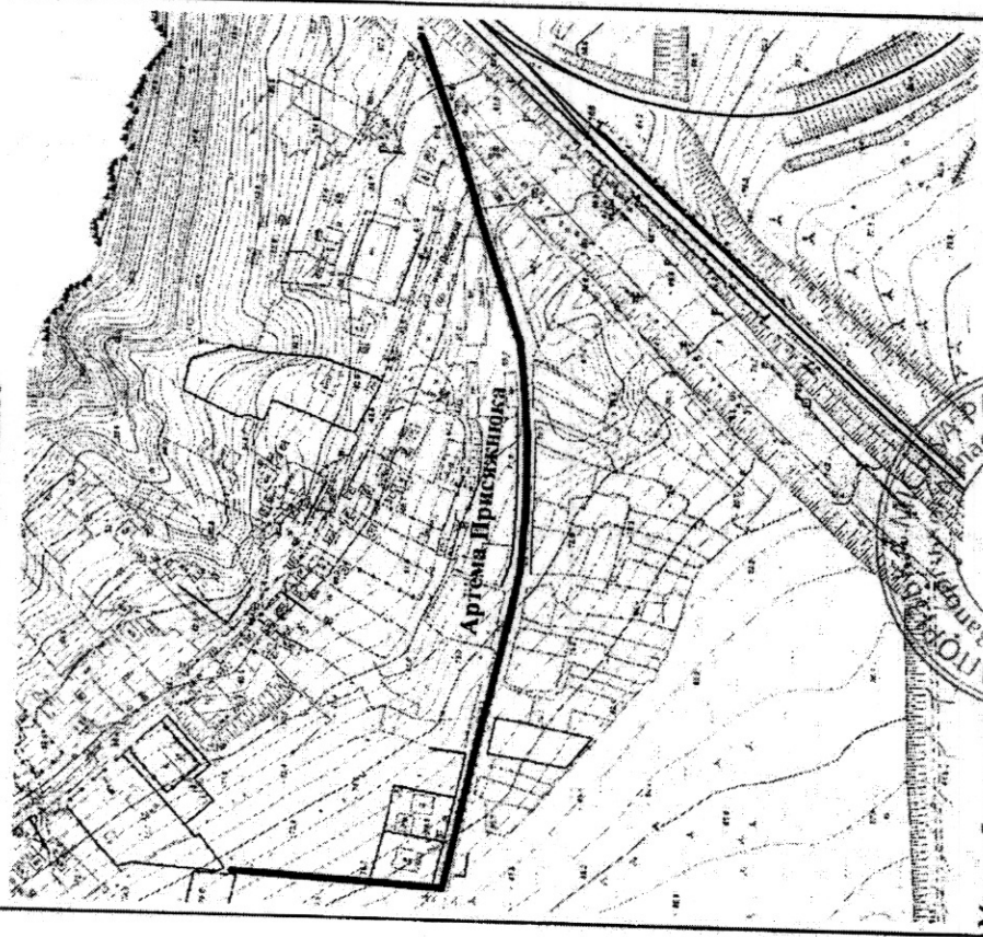
СХЕМА розташування вулиці Артема Присяжнюка М 1:2000

Додаток до рішення міської ради 29.11.2023 № 82