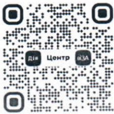
ВЕБПОРТАЛ ЦЕНТРУ «ВІЗА» («ЦЕНТР ДІЇ»)

Додатково повідомляємо, що прийом документів для державної реєстрації речових прав на нерухоме майно та їх обтяжень, юридичних осіб, фізичних осіб-підприємців, здійснюються через Центр адміністративних послуг «Віза» («Центр Дії») виконкому Криворізької міської ради, або його територіальні підрозділи, виключно за попереднім записом: