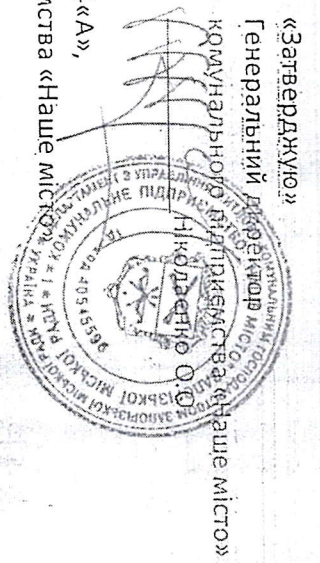
Схема прибудинкової території, закріпленої за житловим будинком по вул. Патріотична, буд. 34«А», який знаходиться у господарчому відомі комунального підприємства «Наше місто»

«Гоголженю» Районна адміністрація Зaporізької міської ради по Дознесенівському району