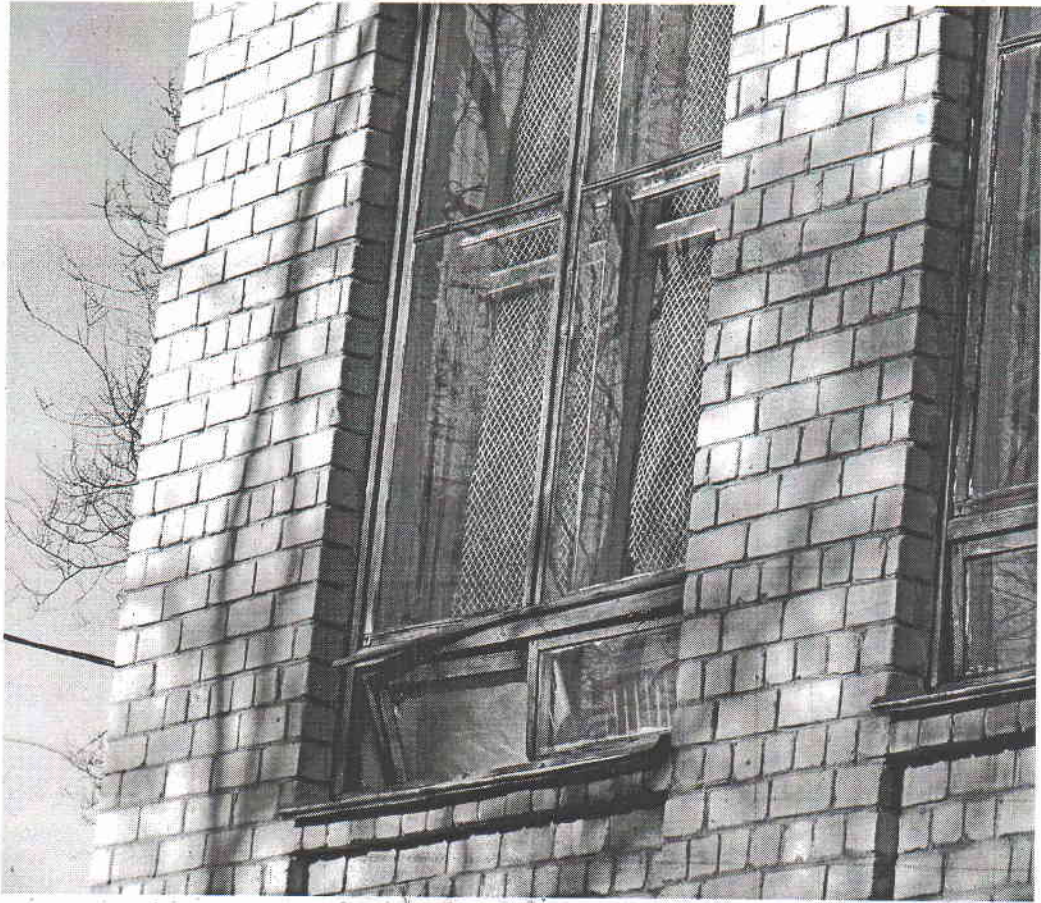
Рис.4. Механическое повреждение переплетов.