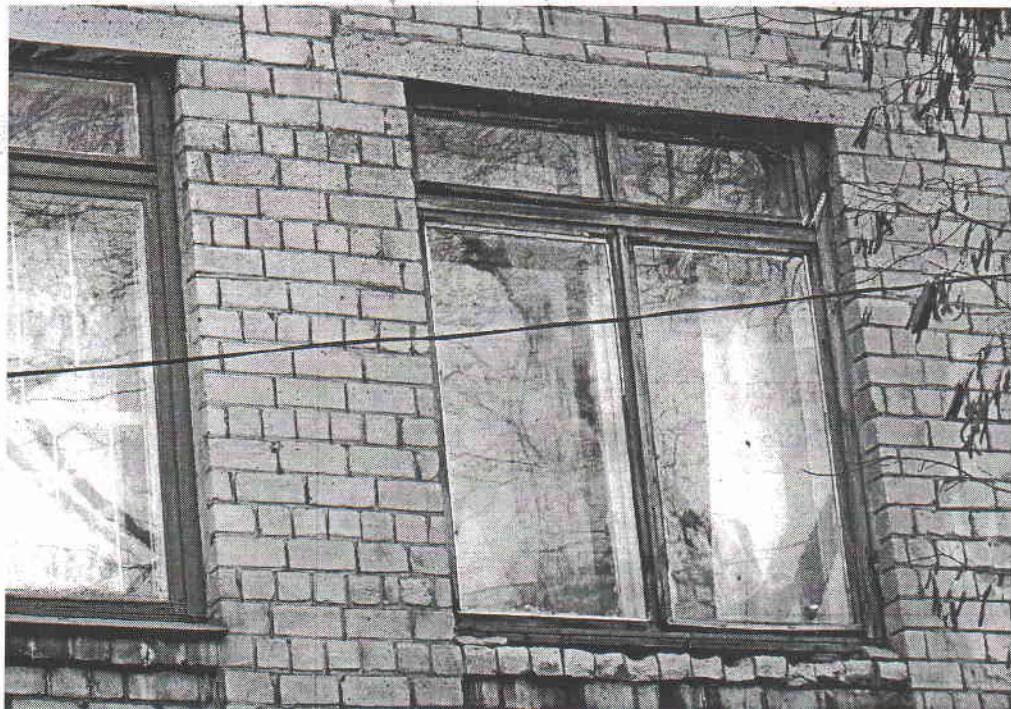
Рис. 6. Отсутствие металлических отливов.