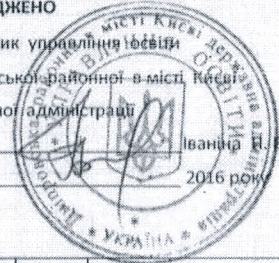
Розрахунки до кошторису теплоенергосії по галузі ОСВІТА та КФК 070101 на 2016 рік (спеціальний фонд)