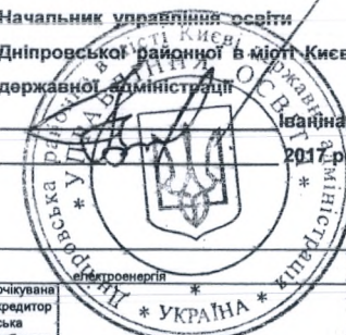
Розрахунок кошторису на оплату енергоносіїв по галузі освіта та КТКВ 070401 на 2017 рік (загальний фонд)