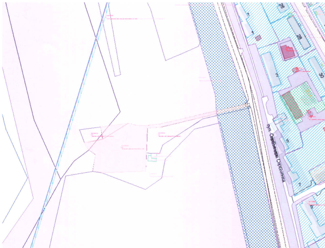
План - схема території зони відпочинку в районі водно-веслувальної бази №1 по вул. О.Сербіченка