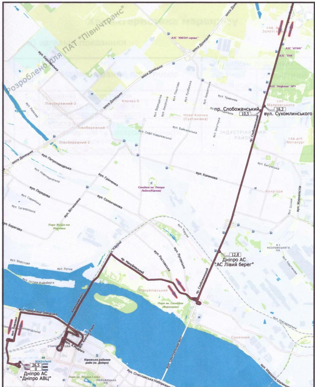
схема маршруту Дніпро (Дніпро АВЦ) – Перемога