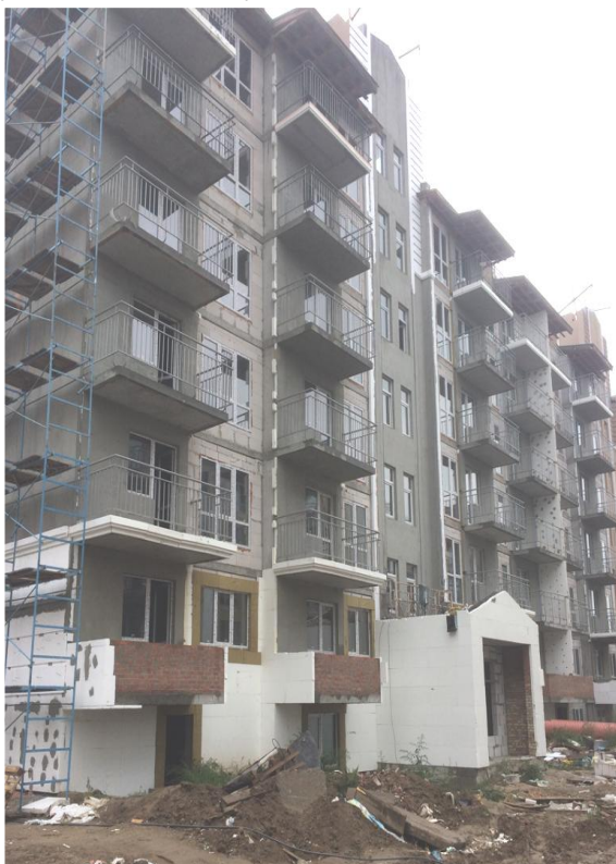
Фото 1. Житловий будинок за адресою: м. Київ, вул. Метрологічна, 26, станом на 24.09.2018

Пунктом 1.8 договорів про участь у фонді фінансування будівництва, укладених Службою з ТОВ «Фінансова компанія Прайм» (управитель фонду