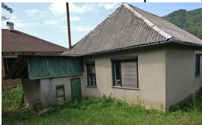
Фото 3. Житловий будинок в смт Кольчино

▪ Аудит, проведений у Кольчинській селищній раді Мукачівського району Закарпатської області (голова Дуб М. В.), засвідчив, що придбаний селищною радою для двох дітей-сиріт житловий будинок у смт Кольчино, вул. Шелестівська, 238, загальною площею 101,0 м 2 має характеристики, нижчі за встановлені житловими нормативами, і є непридатним для проживання .