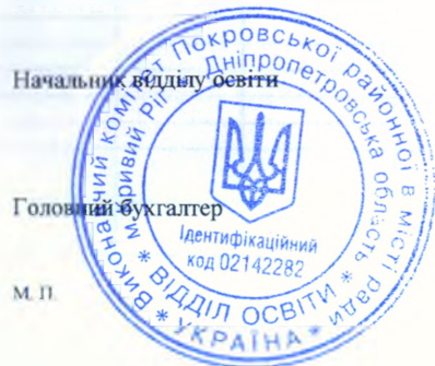
С.А.Коргут (підпис) (ініціали і прізвище)