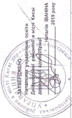
Розрахунок зведеного кошторису на оплату енергоносіїв по вул. "Освіт" та КПКВ 4311020 на 2019 рік (загальний фонд)