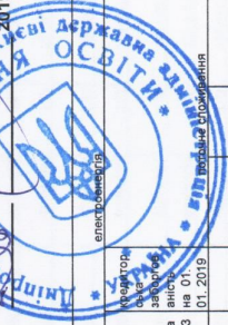
Розрахунок зведеного кошторису на оплату енергоносіїв по галузі "Освіта" та КПКВ - 4311020 на 2019 рік (загальний фонд)

ЗАТВЕРЖЕНО Начальник управління освіти Дніпровської районної в місті Києві державної адміністрації Назарія ІВАНІНА 01.2019 року