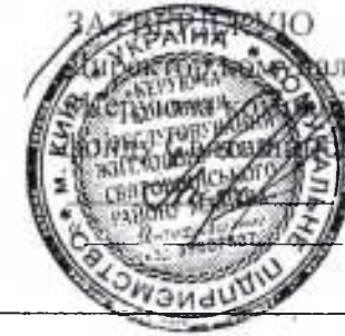
Схема прибирання прибудинкової території житлового будинку № 21 по вул. Якуба Коласа

з обслуговування житлового району м.Києва» В.Б.Григоренко 2017р.