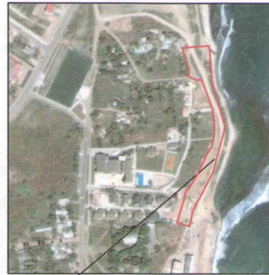
земельна ділянка, що відводиться