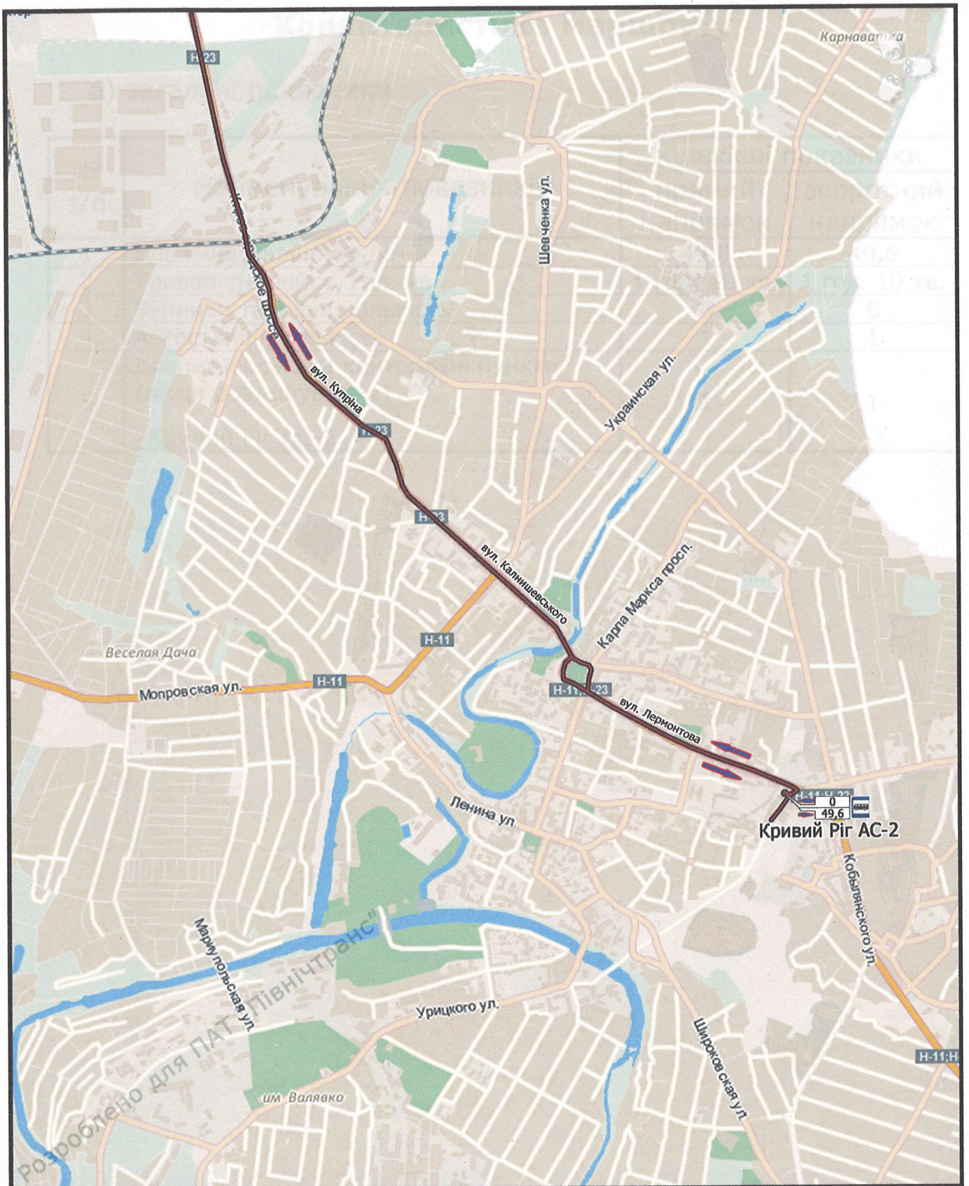
схема маршруту Кривий Ріг - Анастасівка