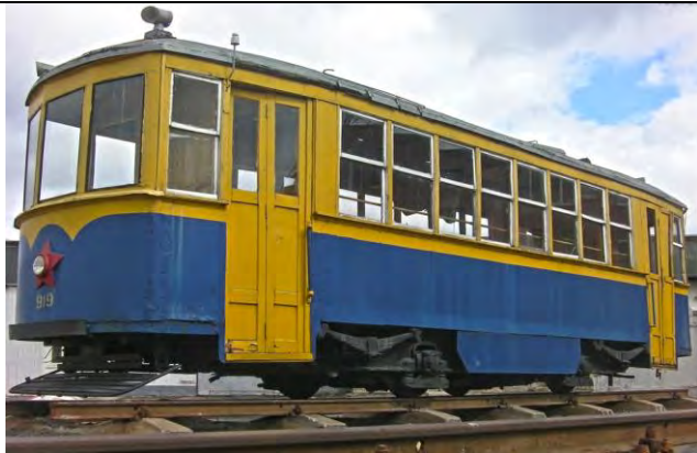
трамвай на території ІЕРЦ по вул. Виборзькій, 111 (квітень 2016 року)