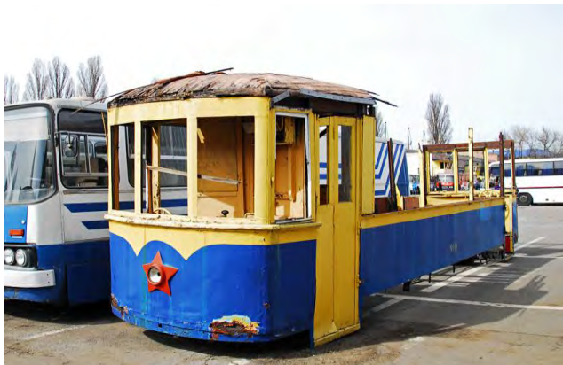
трамвай на території ІЕРЦ по вул. Виборзькій, 111 (березень 2017 року)