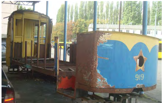
трамвай на території СТОА по вул. Сім'ї Сосніних, 3/5 (вересень 2019 року)

Інформативно, фотографії трамваю за 2016 та 2017 рік взято із загальнодоступних джерел інформації мережі Інтернет.