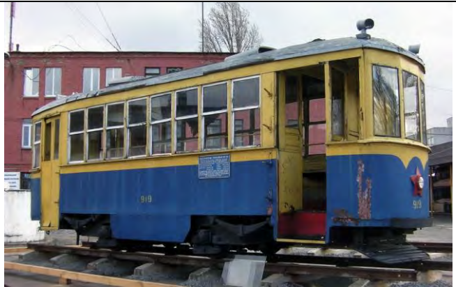
трамвай на території ІЕРЦ по вул. Виборзькій, 111 (квітень 2016 року)