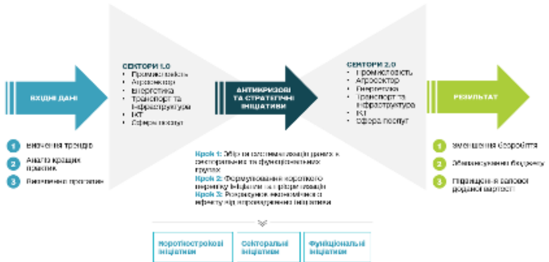
Схема. Підхід до розроблення Програми

Крім того, сформовано зведений перелік пріоритетних видів економічної діяльності за таким алгоритмом: