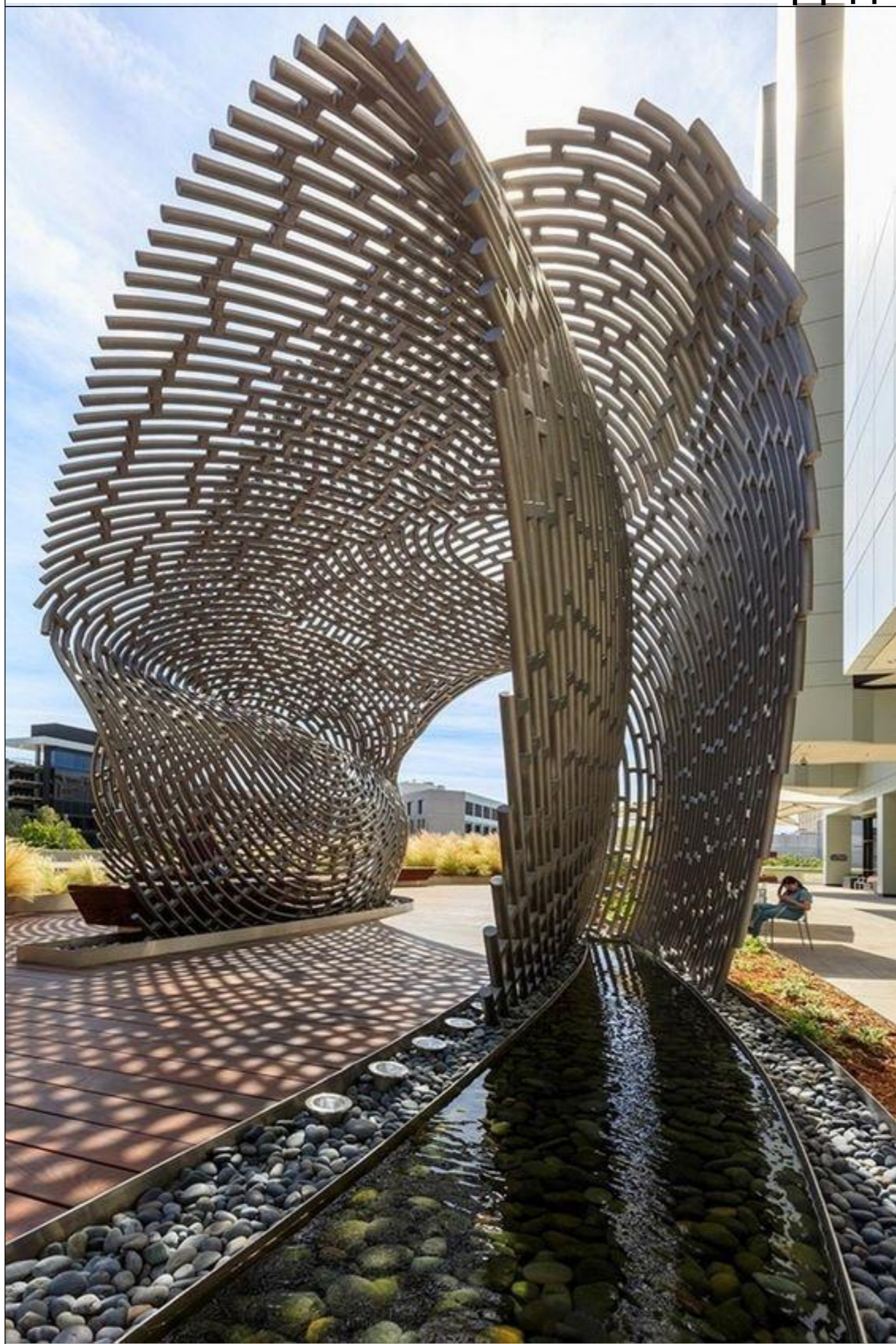
Вхідна група №1