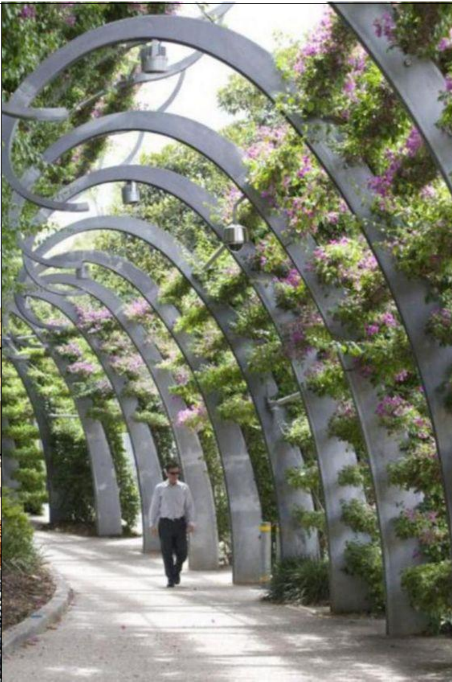
Вхідна група №2