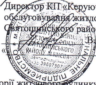
Схема прибирання прибудинкової території житлового будинку № 5 по вул. Степанченка Василя